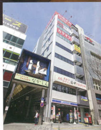
堺市役所前という絶好のロケーションで営業を行なう。新築ビルの竣工に合わせて6~8階にテナント入居

同社では堺東店を基幹店と位置づけており、焼き立てパン食べ放題(250円)、ソフトクリーム食べ放題(200円)など独自サービスを提供しオペレーションに工夫を