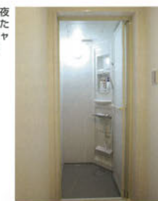
カラオケルームで夜を明かす客もいるため、男女別のシャワールームを完備