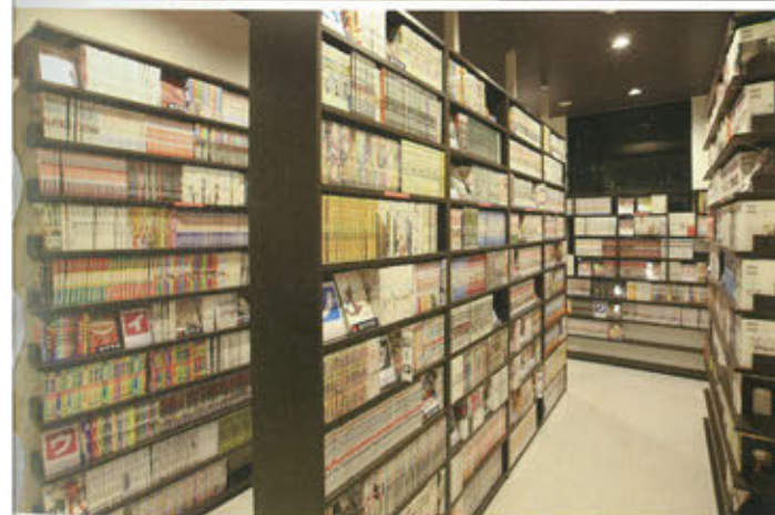
7階の共用スペースには5,000冊を超えるコミック・雑誌が整然と並ぶ