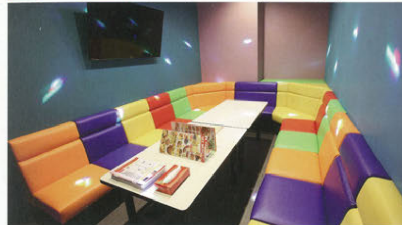
利用人数、用途に合わせて多彩なカラオケルームを用意する