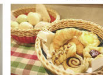
焼き立てパン食べ放題プランをオプションで用意