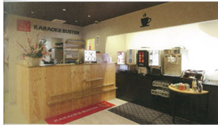
7階受付。ドリンクバーは各フロアに設置する