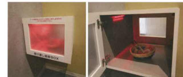
カラオケルームでは全国初となる受け渡し返却ボックス。スタッフが飲食を入るとボックス内が赤く照らされ、客に知らせる