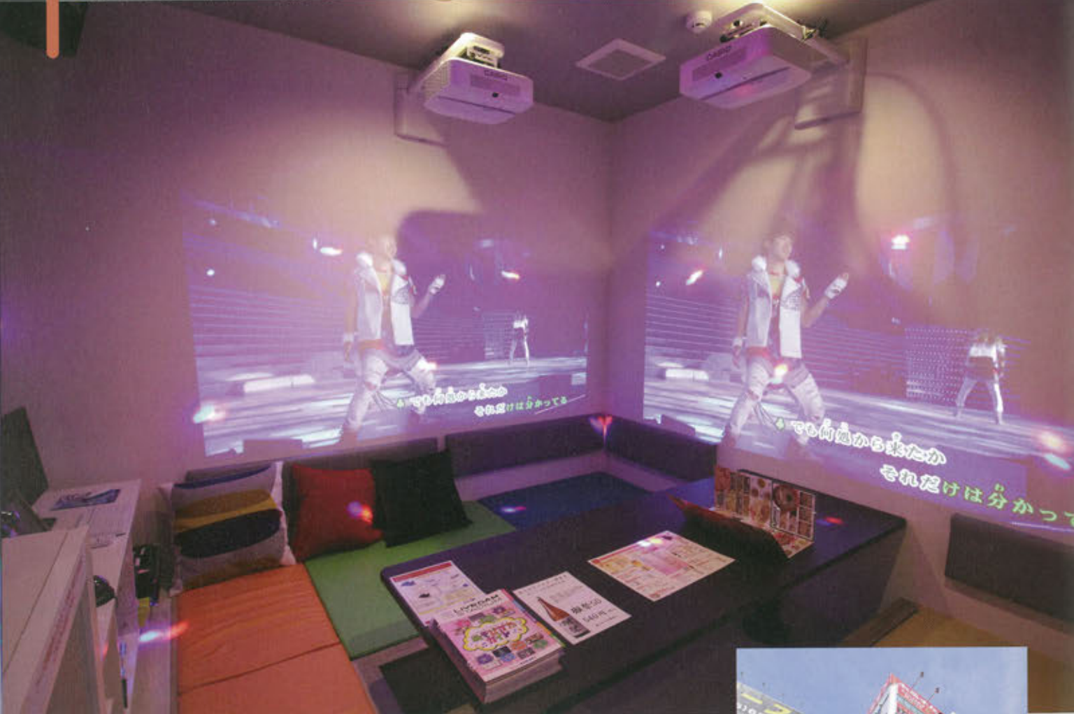
各フロアに1ルームずつ配置された「プロジェクタールーム」。大迫力の映像・音響が楽しめ人気が高い

複合カフェ「コミックバスター」を全国展開する㈱アクロスは2016年3月30日、「カラオケバスター堺東店」をオープンした。「カラオケバスター」は、アクロスが昨年から店舗展開を進める新業態ブランド。カラオケボックスに複合カフェのコンテンツを採り入れたもので、堺東店はカラオケバスターとしては3店舗目となる。